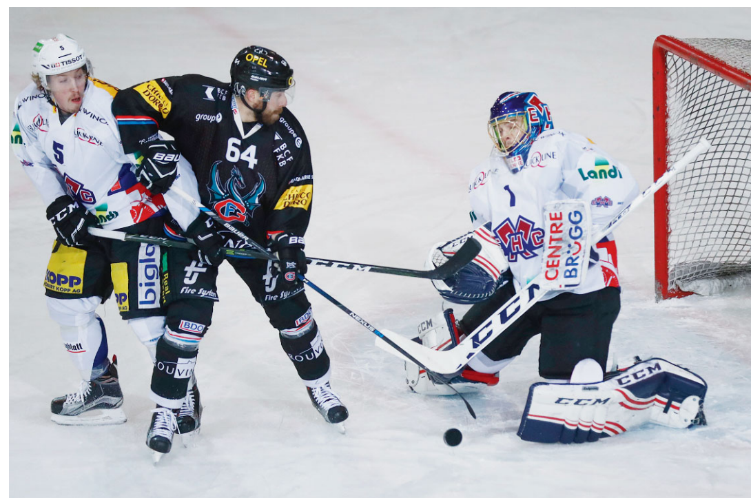
Nach dem gestrigen Spiel in Fribourg trifft der EHC Biel heute schon wieder auf Gottéron. Les deux équipes se retrouvent ce soir après s'être déjà affrontées hier à Fribourg.