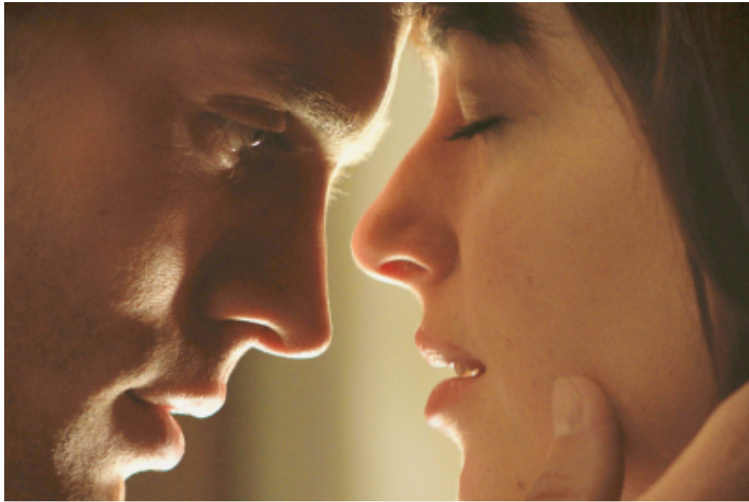
La rencontre finalement peu nuancée d'un riche et d'une étudiante vierge. UNIVERSAL

C'est Universal Pictures qui a décroché la timbale, acquérant les droits d'adaptation pour la modique somme de cinq millions de dollars. Pour donner une touche un brin «arty» à cette dé-