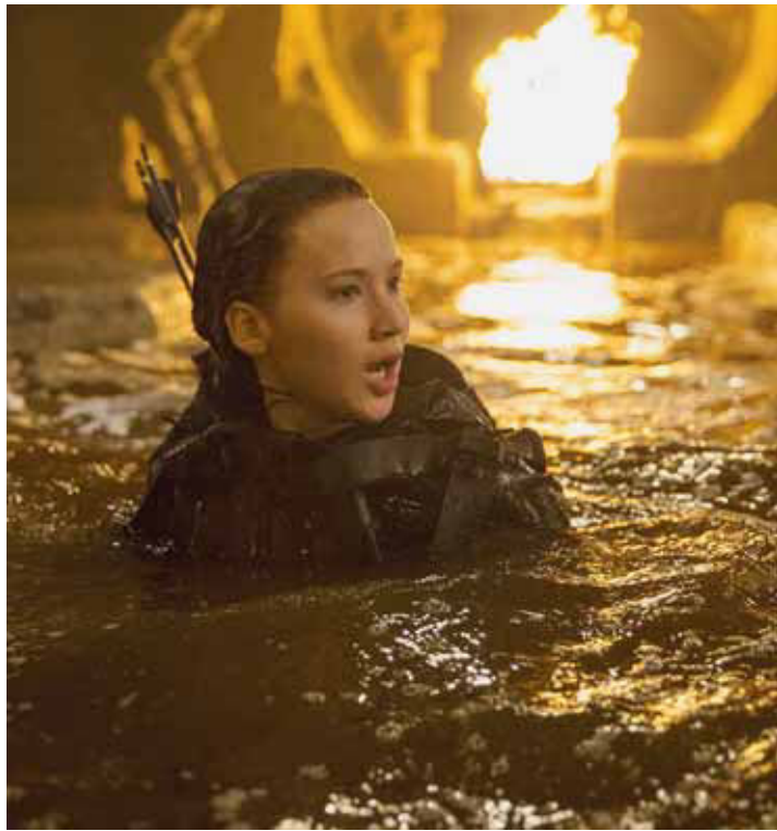
La guerre est déclarée. Katniss, la charismatique Jennifer Lawrence, ne souhaite qu'une seule chose: tuer l'abominable Snow qui lui pourrit la vie depuis quatre ans..