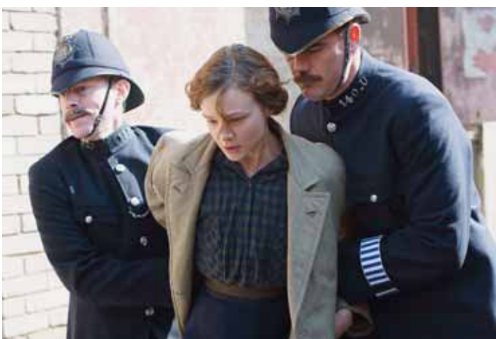
Des suffragettes se sont sacrifiées pour que les femmes d'aujourd'hui puissent s'exprimer au même titre que les hommes.

INFO+ En première semaine au cinéma Beluga de Bienne.