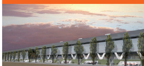
Stades de Bienne