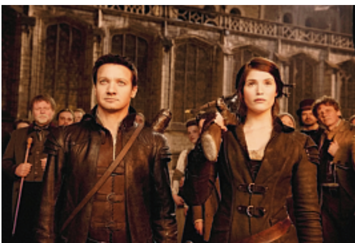
Les deux orphelins sont désormais de célèbres chasseurs de sorcières.

A voir les 9 et 11 mars au cinéma de Moutier, ainsi que le 10 mars à Tramelan.