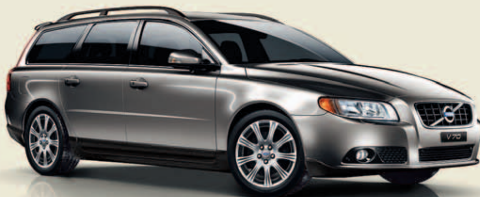
VOLVO V70 STOCKHOLM

Volvo fête les 50 ans de la ceinture de sécurité à trois points, une invention dont nous sommes très fiers et qui a sauvé jusqu'à présent la vie de plus d'un million de personnes. Nous vous faisons une offre spéciale à l'occasion de ce grand jubilé: si vous vous décidez maintenant pour une Volvo V70 ou une Volvo XC70, vous obtenez le Stockholm Package pour seulement CHF 50.- . Vous profitez ainsi d'un avantage financier allant jusqu'à CHF 9700.-.