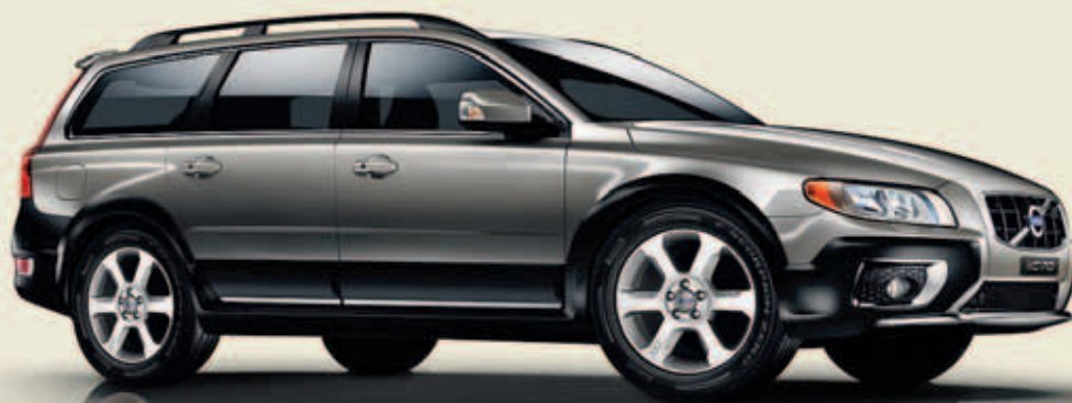
VOLVO XC70 STOCKHOLM

Découvrez notre offre de jubilé en faisant par exemple un essai routier chez nous. Nous nous réjouissons votre visite.