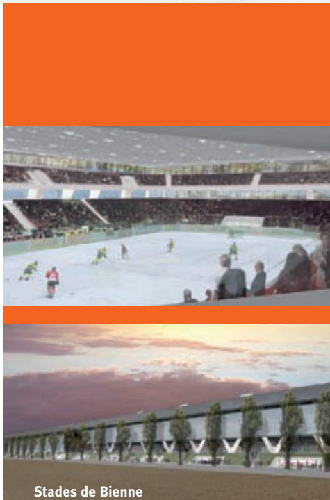
Stades de Bienne

Et surtout un max de succès pour la saison 2008/2009 !