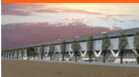
Stades de Bienne