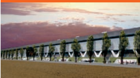
Stades de Bienne