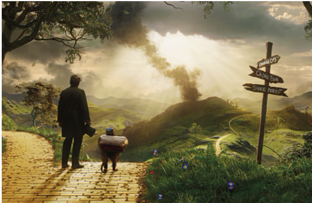
un miteux prestidigitateur s'échoue dans un monde de magie et de monstres pour y être accueilli en messie.

Classique de la littérature anglophone puis du cinéma, «Le Magicien d'Oz» a enchanté des générations entières avec son univers onirique et sa pléiade de personnages plus étranges les uns que les autres. Après une tentative quelque peu ratée en 1985, Disney revient en 2013 avec un préquel basé sur l'œuvre américaine mais dont le scénario est entièrement original. Derrière la caméra, on retrouve Sam Raimi, spécialiste de l'horreur et réalisateur de la trilogie «Spider-Man et qui fait ici ses premiers pas dans le fantastique.