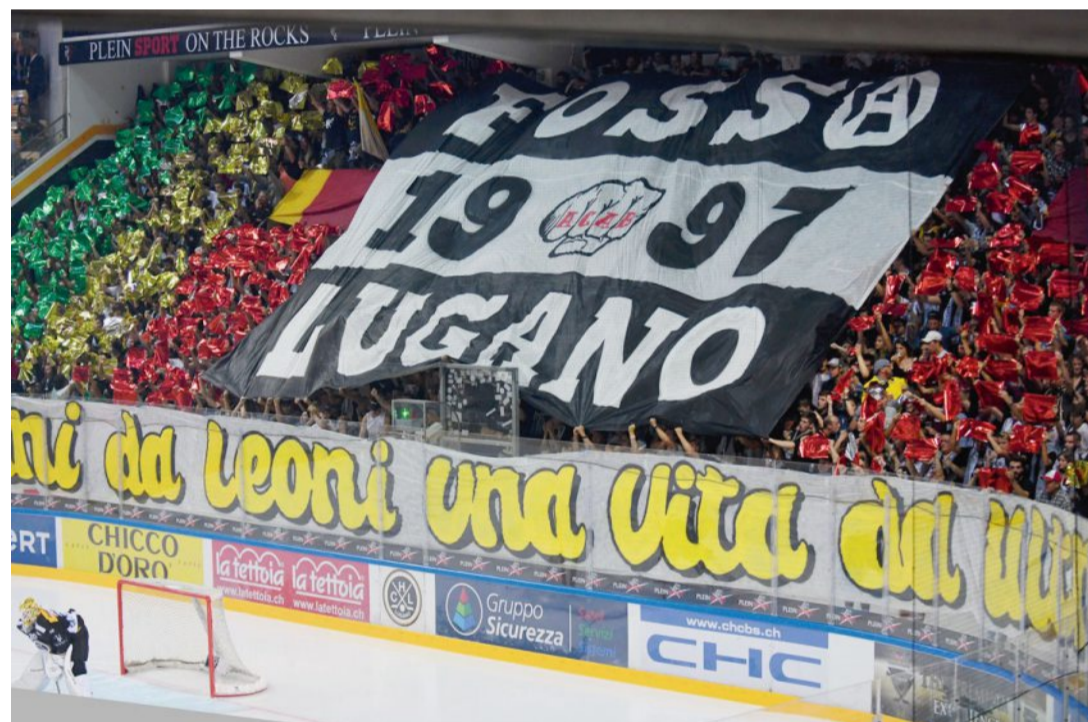
Beim Verkauf von Saisonabonnements hat der HC Lugano die Nase vorn. A la Resega, pas moins de 5000 personnes ont acheté l'abonnement de saison.

In Biel sieht die Zuschauerentwicklung nicht so rosig aus wie im Tessin. Zwar sind die Besucherzahlen nach der Eröffnung der Tissot Arena angestiegen (letzte Saison im alten Eisstadion: 4676; Saison 2015/16: 5896). Aber seither stagniert die Zahl. Diese Saison zählten die Bieler durchschnittlich 5369 Zuschauer pro Begegnung (Playoff-Spiele nicht eingerechnet). Mittelfristig wollen die Verantwortlichen des EHC Biel einen Durchschnitt von 6000 verkauften Plätzen erreichen. Vielleicht könnte die Strategie des HC Lugano bei der Umsetzung dieses Ziels als Beispiel dienen.