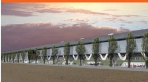
Stades de Bienne