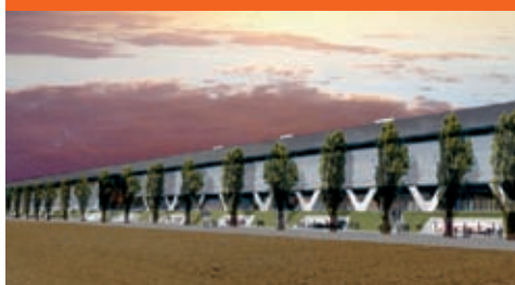
Stades de Bienne