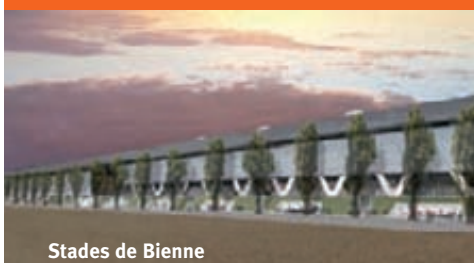
Stades de Bienne