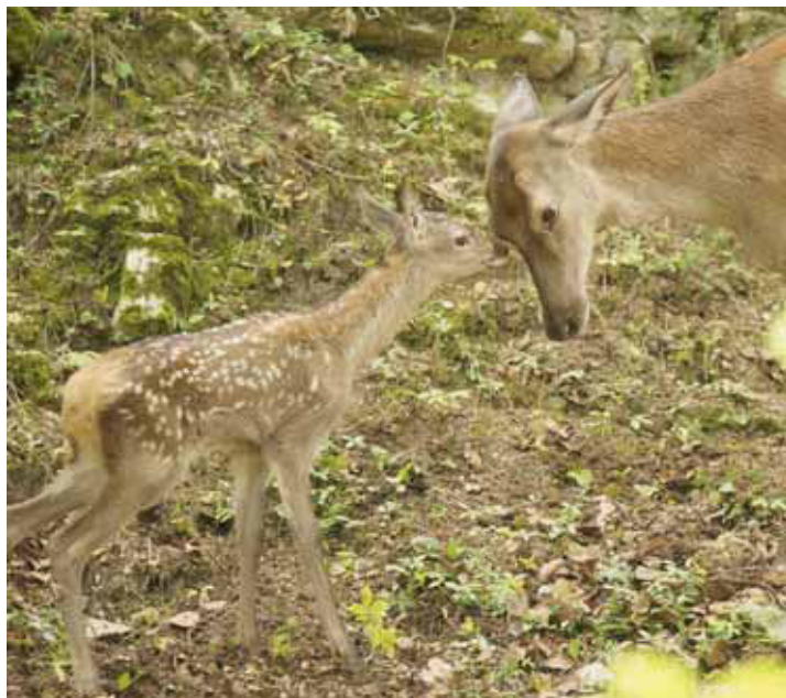
Jacques Perrin nous emmène, une fois encore, au plus près des animaux sauvages...

Après le «Peuple migrateur» et «Océans», Jacques Perrin et Jacques Cluzaud récidivent dans