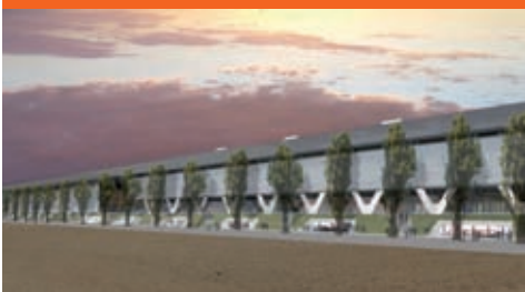
Stades de Bienne