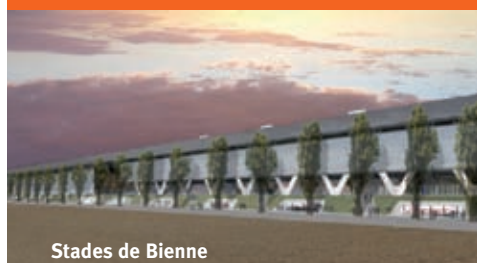
Stades de Bienne