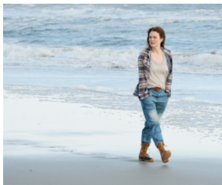
Un film porté par la magnifique interprétation de Julianne Moore.

Récompensée dans de nombreux festivals et lauréate de l'Oscar de la meilleure actrice de cette année, Julianne Moore célèbre avec panache son retour