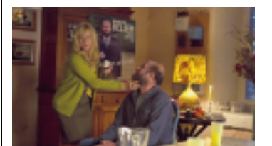
«Une comédie épatante dont on ressort enchanté et en chantant.»