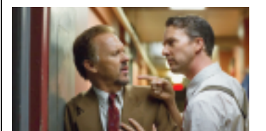
«Un film tapageur formellement brillant, mais lourd, convenu et sans émotion sur un ex-superhéros en quête de rédemption.»