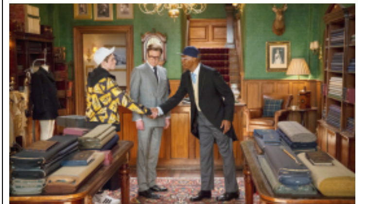
Une parodie du film d'espionnage un peu trop appuyée avec Colin Firth en impayable british. LDD