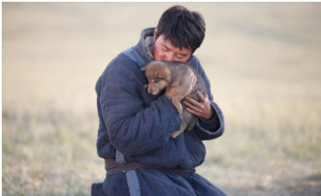
Jean-Jacques Annaud raconte l'histoire d'un étudiant chinois fasciné par les liens qui unissent les loups et les tribus nomades de la Mongolie.

J'ai effectué mon premier voyage en Mongolie avec l'auteur du roman, qui m'a fait découvrir les lieux où s'est passée l'histoire. J'y ai rencontré des témoins, les grands chanteurs mongols et les principaux acteurs. Par la suite,