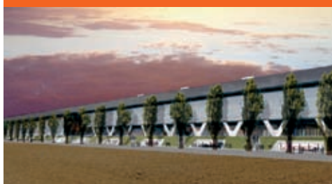
Stades de Bienne